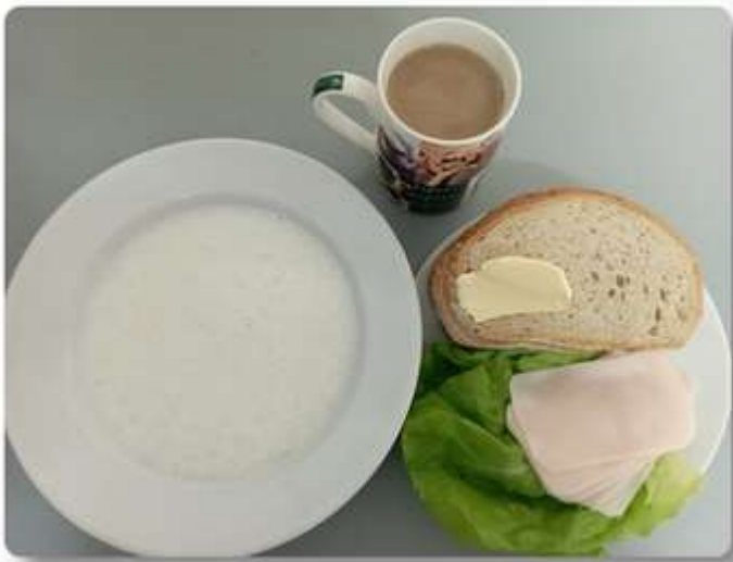
Śniadanie - dieta podstawowa.