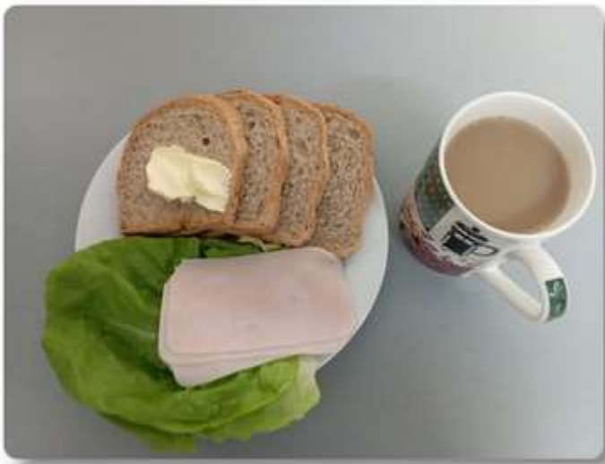
Śniadanie - dieta z ograniczeniem łatwo przyswajalnych węglowodanów.