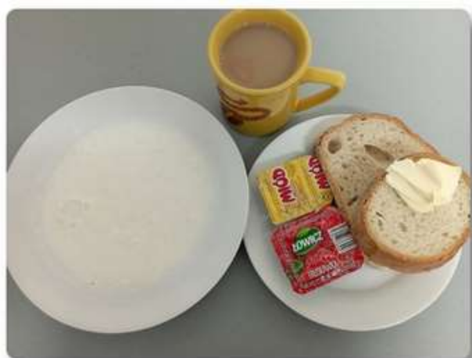
Śniadanie – dieta łatwo strawna.