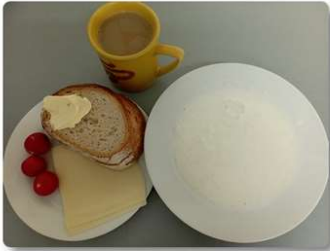
Śniadanie – dieta podstawowa.