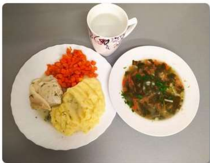
Obiad – dieta łatwo strawna.