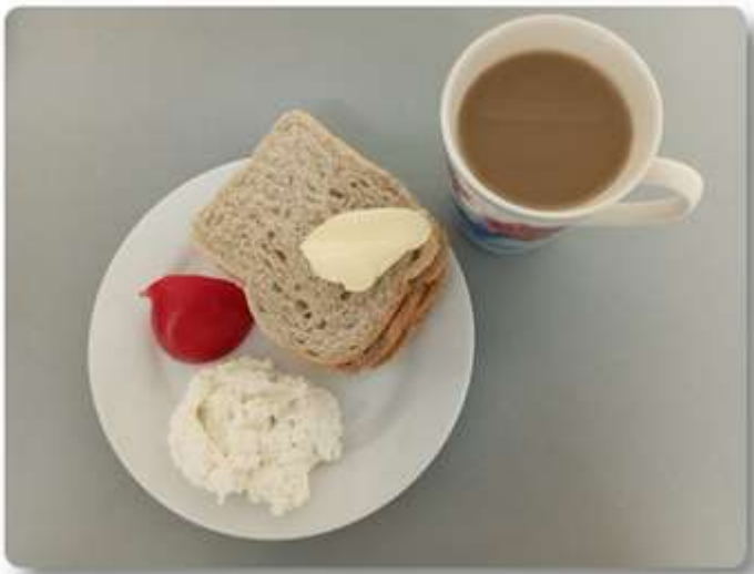
Śniadanie - dieta z ograniczeniem łatwo przyswajalnych węglowodanów.