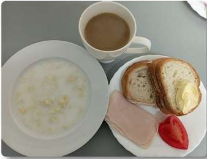
Śniadanie - dieta podstawowa.