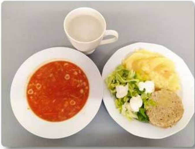
Obiad - dieta z ograniczeniem łatwo przyswajalnych węglowodanów.