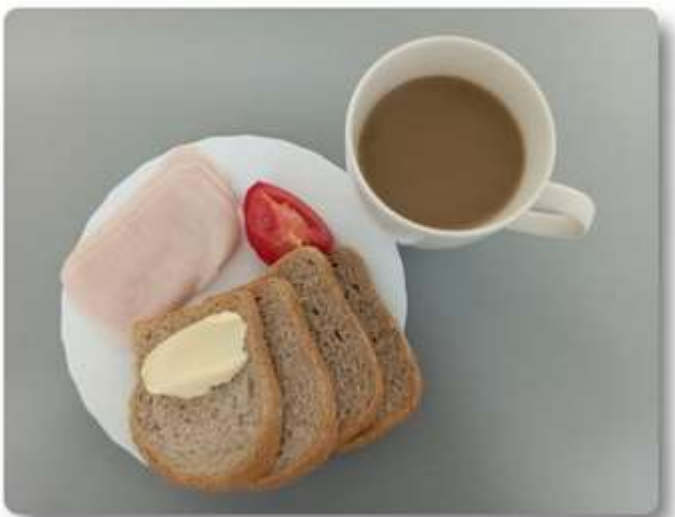
Śniadanie - dieta z ograniczeniem łatwo przyswajalnych węglowodanów.