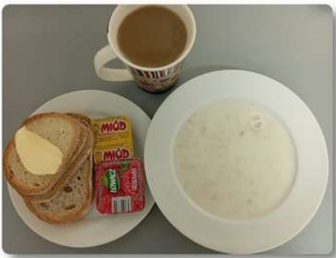
Śniadanie - dieta podstawowa.