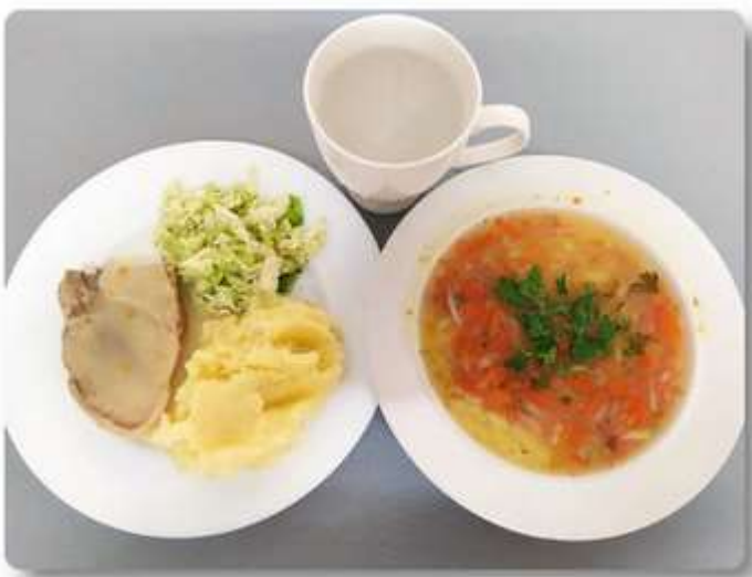
Obiad - dieta z ograniczeniem łatwo przyswajalnych węglowodanów.