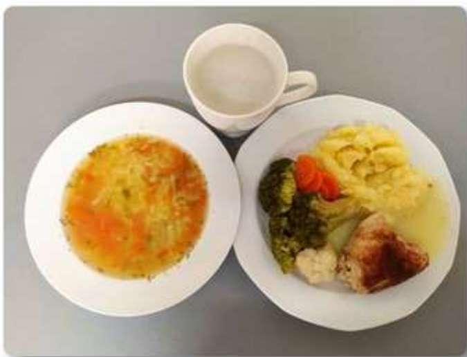
Obiad - dieta łatwo strawna.