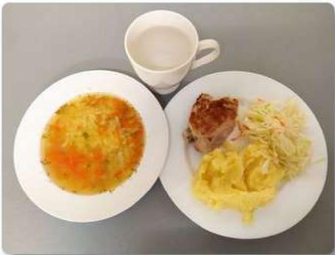
Obiad - dieta podstawowa.