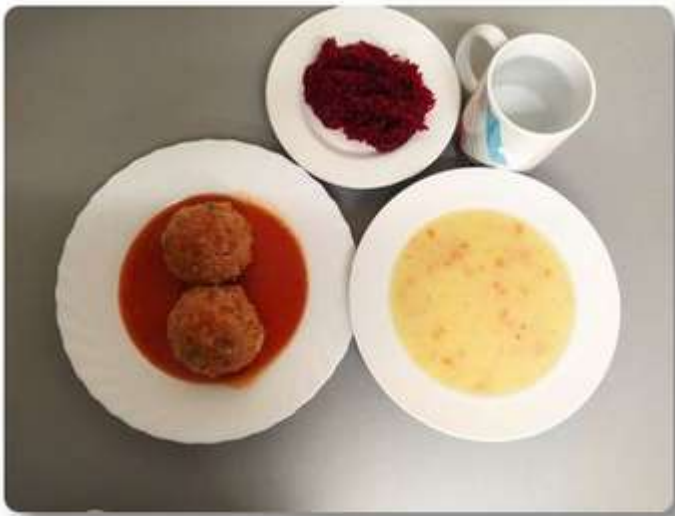
Obiad - dieta łatwostrawna.