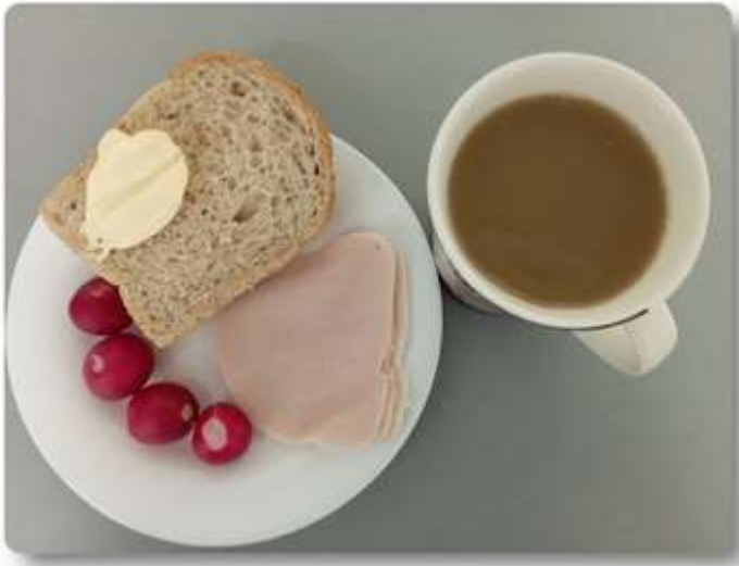
Śniadanie - dieta z ograniczeniem łatwo przyswajalnych węglowodanów.