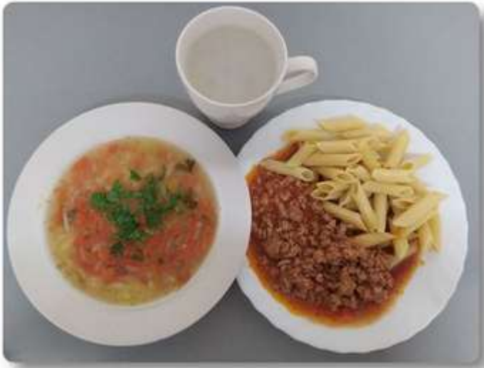
Obiad - dieta podstawowa.