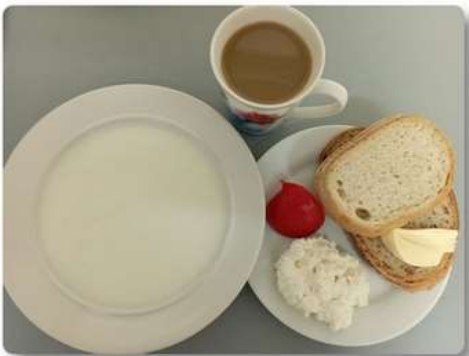
Śniadanie - dieta łatwo strawna.