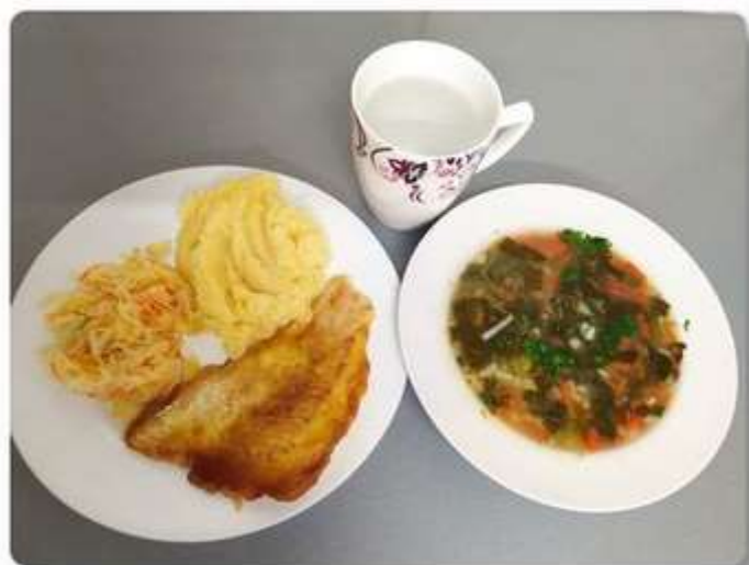
Obiad – dieta podstawowa.