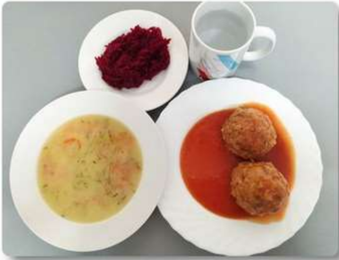
Obiad - dieta podstawowa.